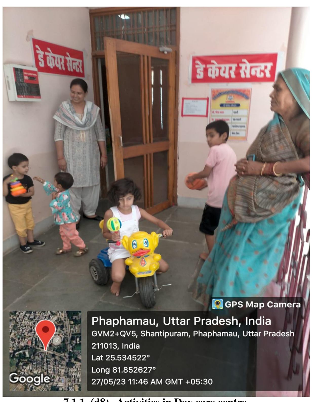
7.1.1. (d8) Activities in Day care centre