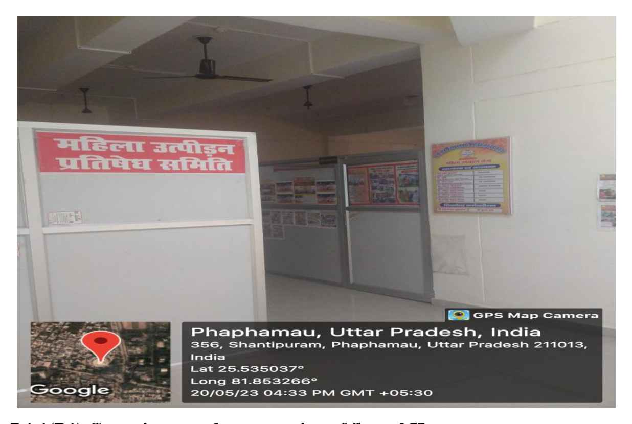
7.1.1(B1) Committee on the prevention of Sexual Harassment

(ii) Workshop on Prevention of Sexual Harassment