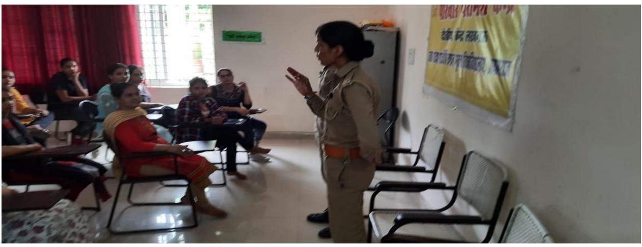
Safety and Security: workshop on self defence