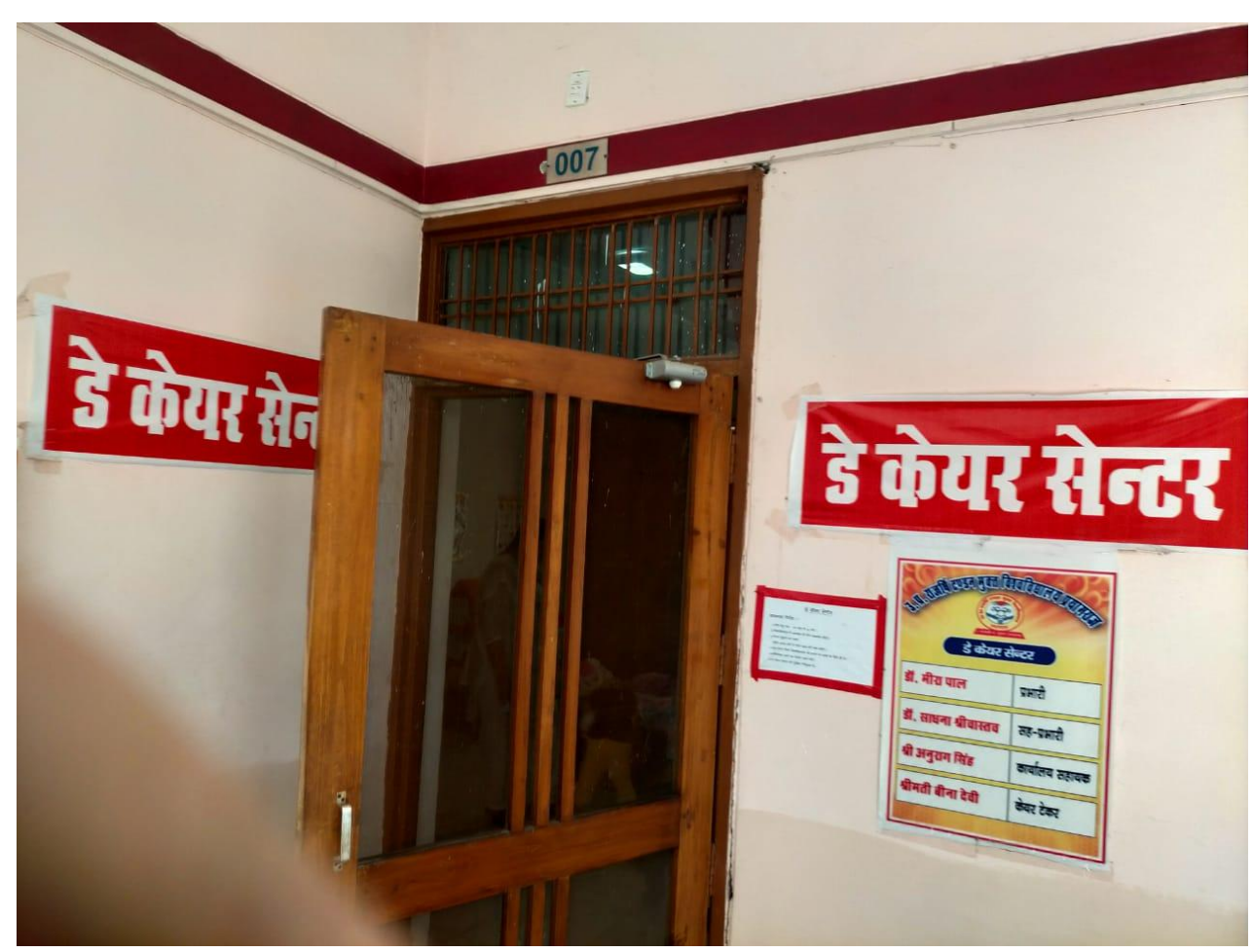
7.1.1. (d9) Day care centre for staff children