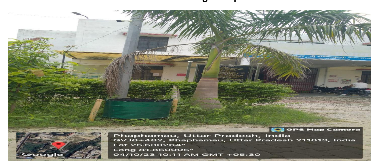
CCTV camera in Yamuna campus