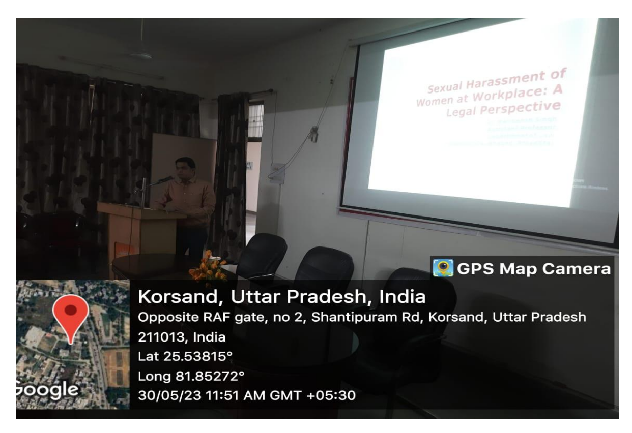
7.1.1(B2) Workshop on prevention of Sexual Harassment