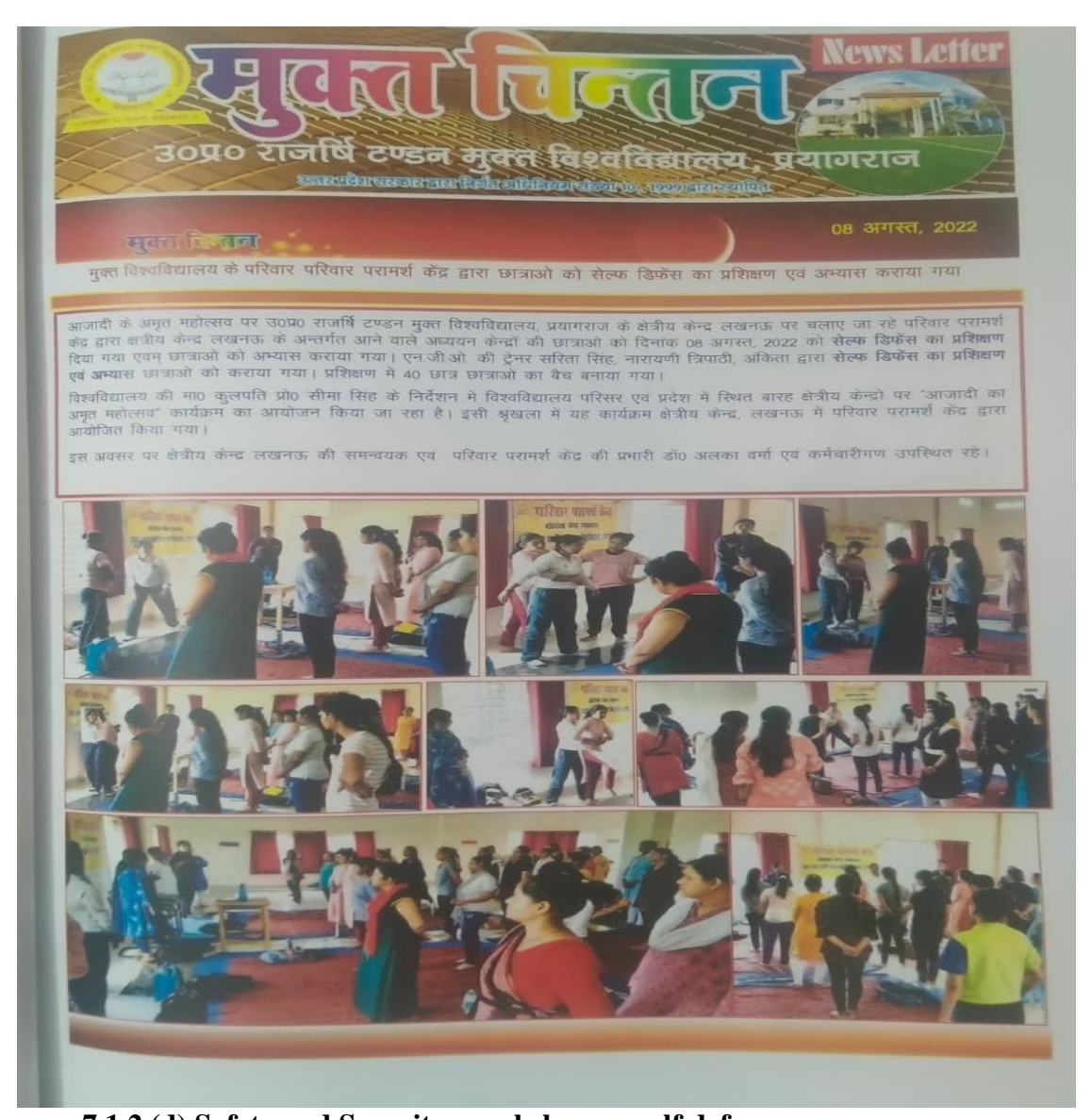
7.1.2 (d) Safety and Security: workshop on self defence