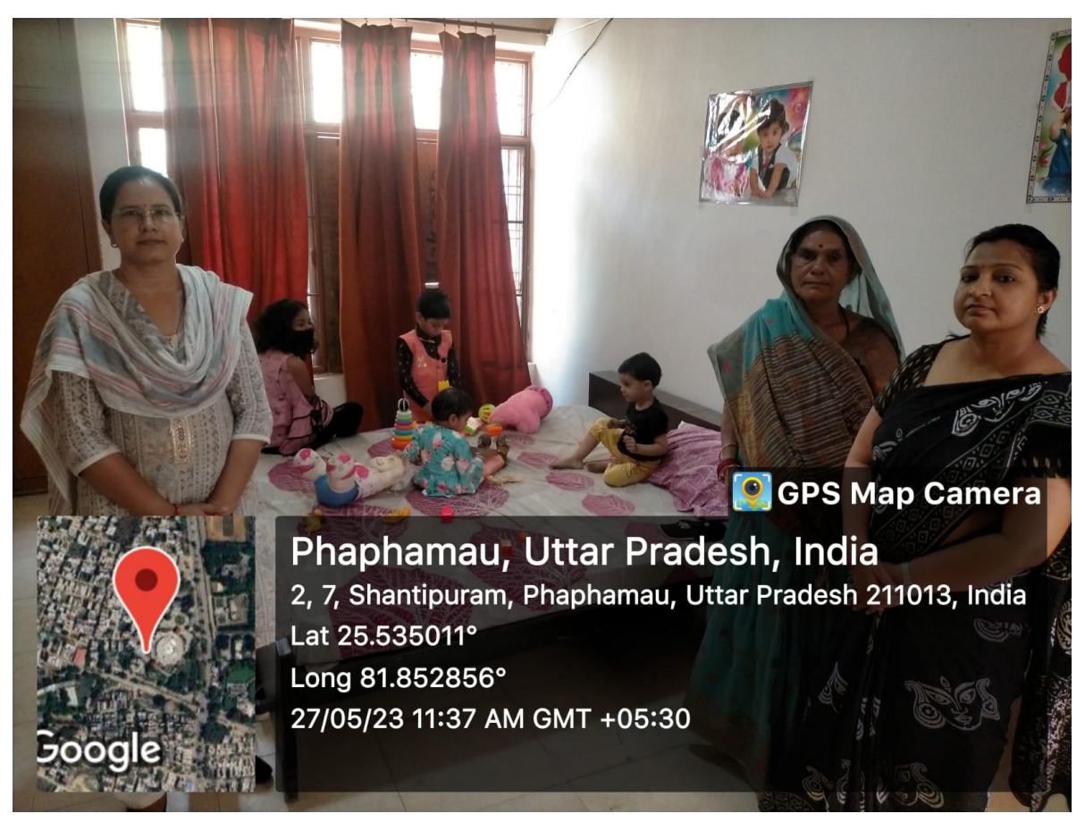
Day care centre staffs