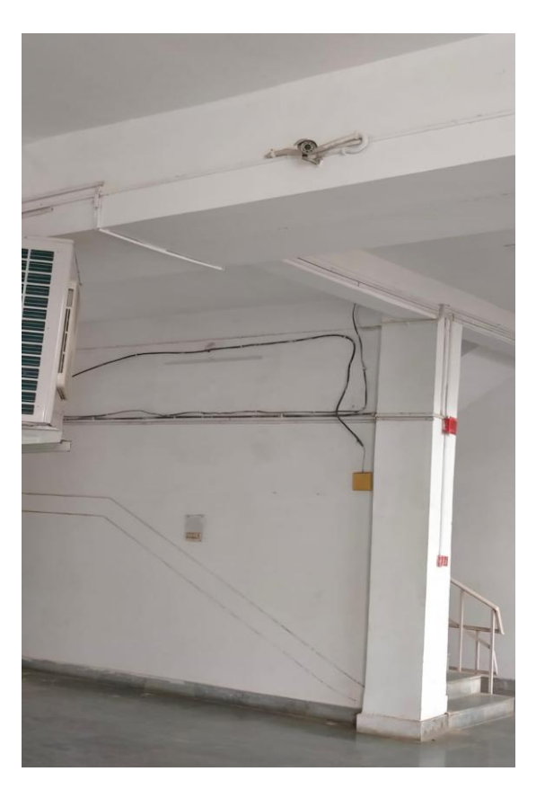
CCTV camera in Ganga campus