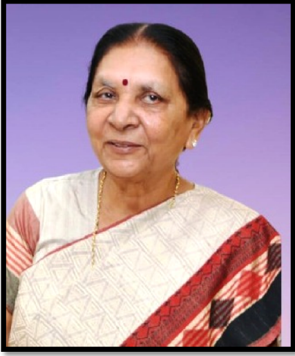
श्रीमती आनदीबेन पटेल माननीया कुलाधिपति, उत्तर प्रदेश